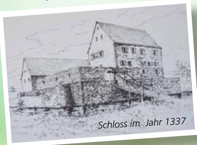
Schloss im Jahr 1337

Konkret wird das in den mindestens drei Ausstellungen, die der BfH jedes Jahr wechselweise zu Kunst und Geschichtsthemen durchführt, den Ausflügen in die nähere Umgebung mit kunst- oder geschichtsbezogenen Zielen, aber auch in Mundart- und Märchenabenden. Im Moment absolut sehenswert ist die große Ausstellung „100 Jahre Sieger Köder“ in der Museumsgalerie im Bürgerhaus. Einen Schwerpunkt der Arbeit bildet neben der Kunst und der allgemeinen Ortsgeschichte besonders die Industriegeschichte, die die Identität Wasseralfingens bis in die neueste Zeit prägt. In diesem Bereich ist die Planung eines Industriepfads - in Zusammenarbeit mit dem Stadtarchiv Aalen - zu nennen ebenso wie die Beschäftigung mit der